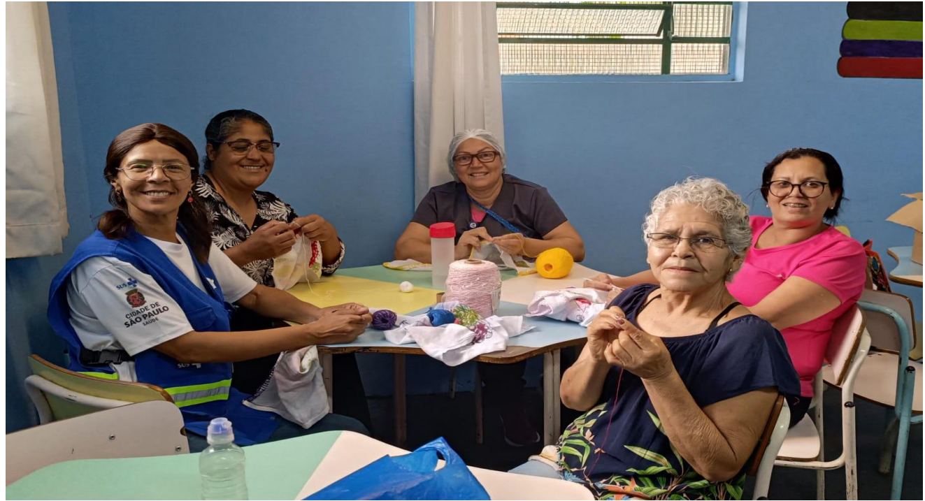
Grupo de artesanato