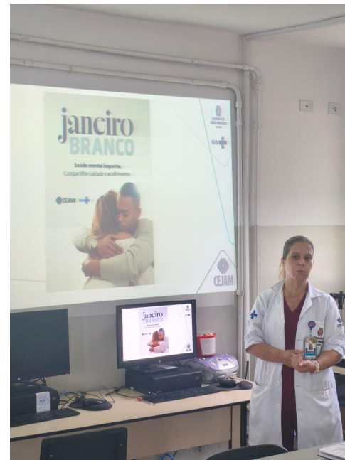
Ação de janeiro branco durante a reunião do Conselho Gestor- Sensibilização realizada pela Farmacêutica Responsável da unidade