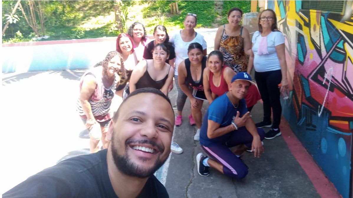
Grupo de zumba