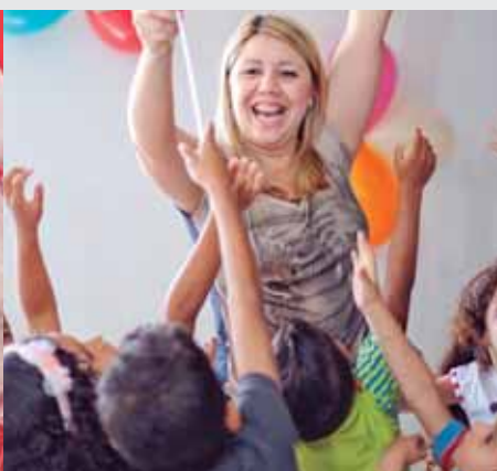
Festa promovida com a contribuição de doadores