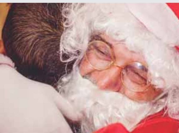
Papai Noel entrega presentes doados por voluntários