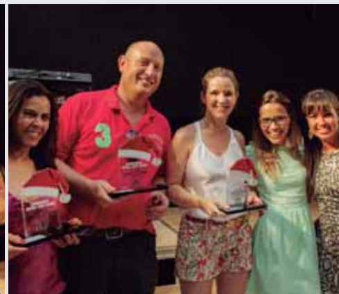
Premiação Gincana Unidade Solidária 2013 Mogi das Cruzes