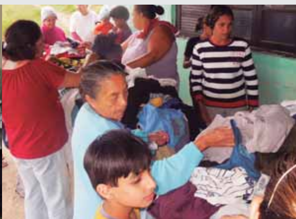
Entrega de doações - Unidade Jd. Guanabara Mogi das Cruzes