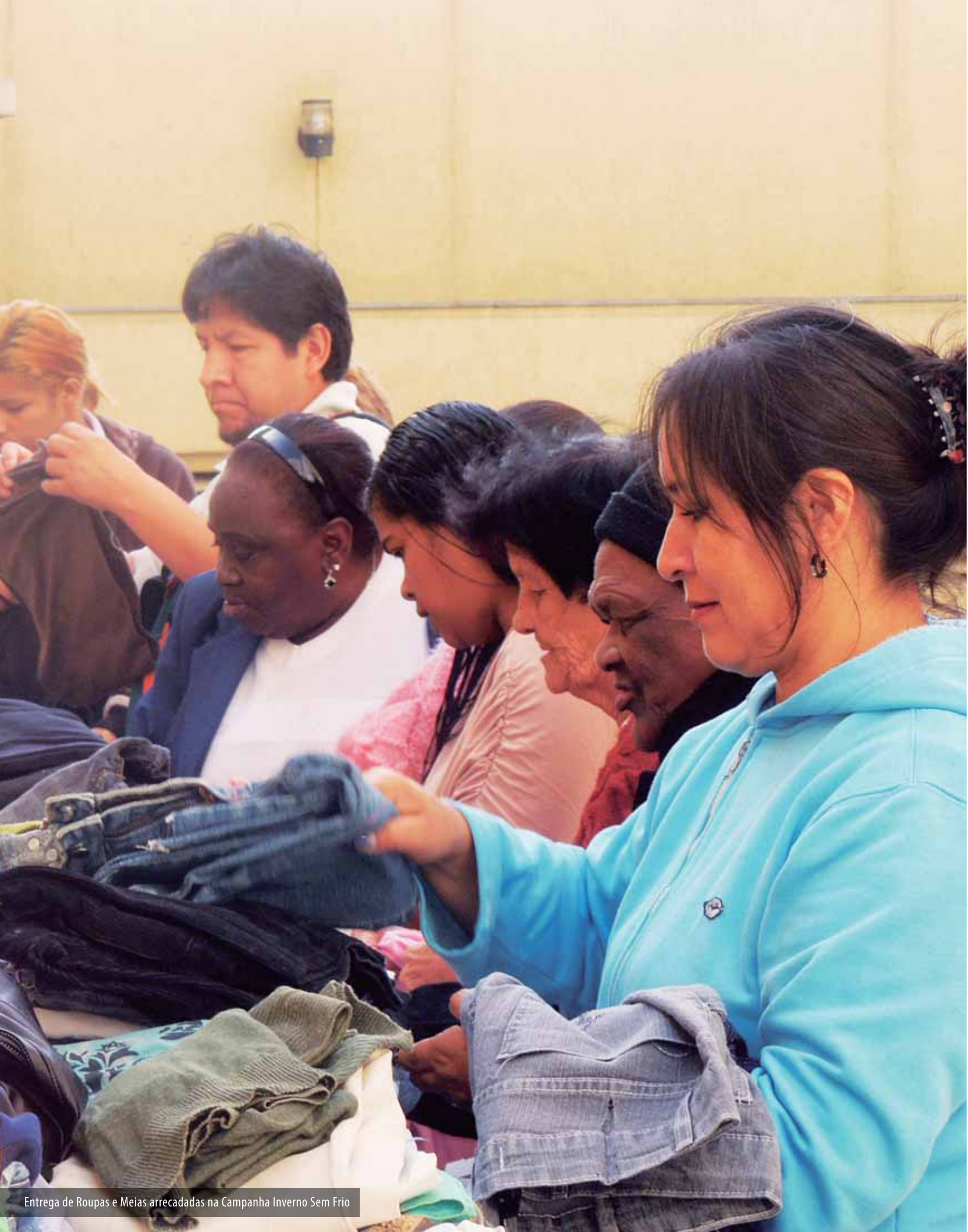
Entrega de Roupas e Meias arrecadadas na Campanha Inverno Sem Frio