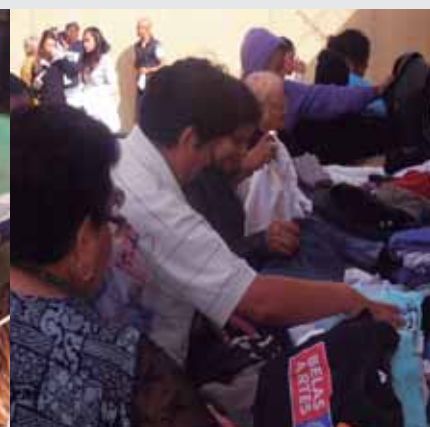
Bazar Solidário IRS Campanha do Agasalho