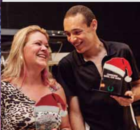
Premiação Gincana Unidade Solidária 2013 Arujá