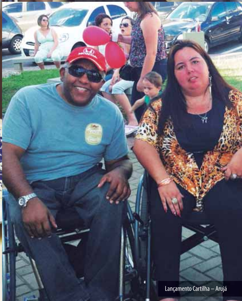
Lançamento Cartilha – Arujá