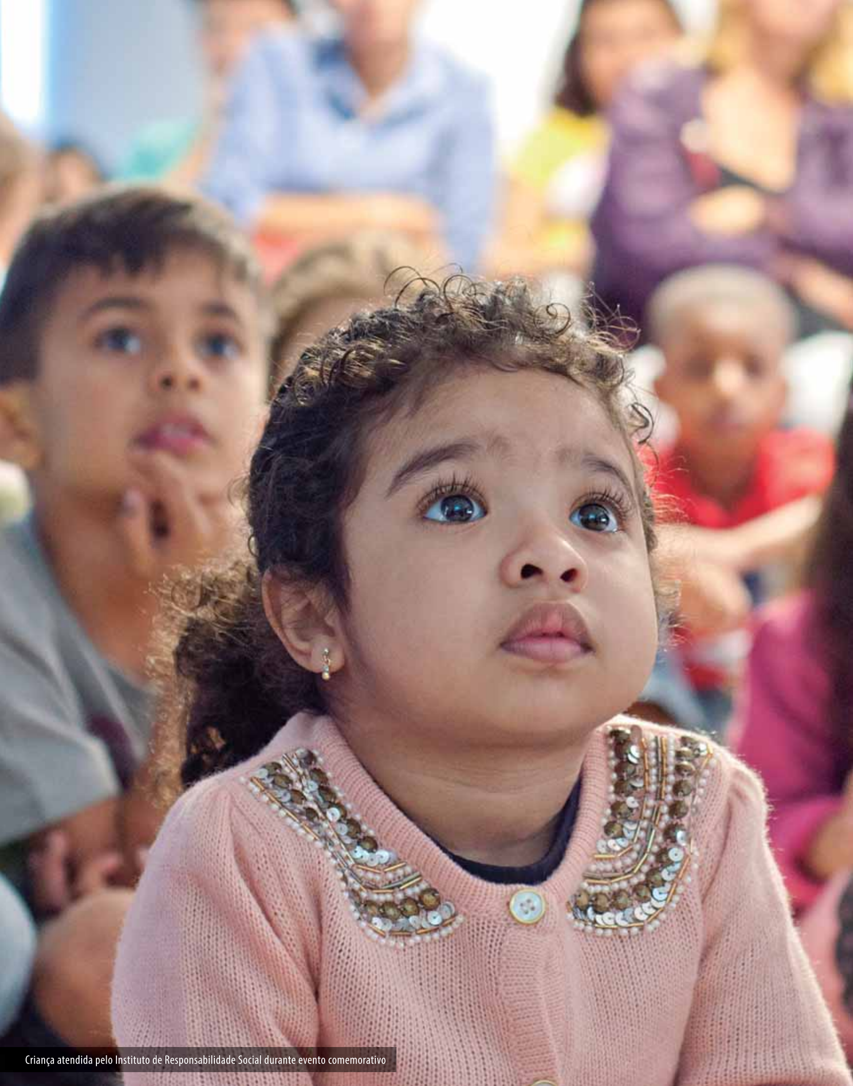
Criança atendida pelo Instituto de Responsabilidade Social durante evento comemorativo