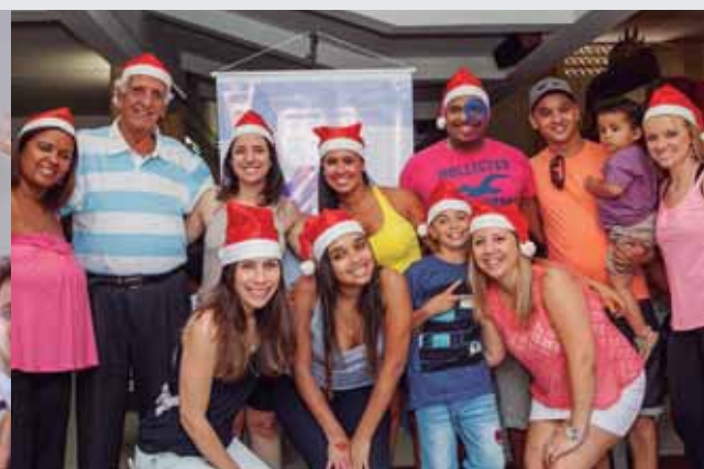
Equipe IRS e Voluntários “Dr. Conforto” durante comemoração de Natal