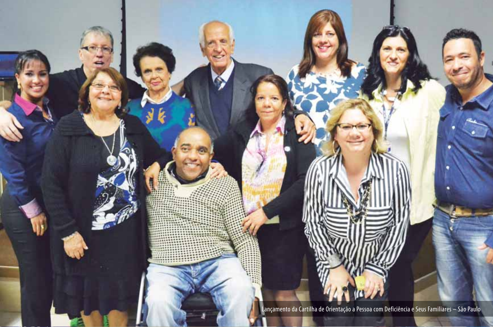
Lançamento da Cartilha de Orientação a Pessoa com Deficiência e Seus Familiares – São Paulo