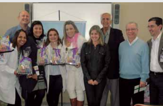
Campanha do Agasalho Mogi das Cruzes Premiação Gincana Unidade Solidária

*27.251 peças de roupas *2.641 pares de meias